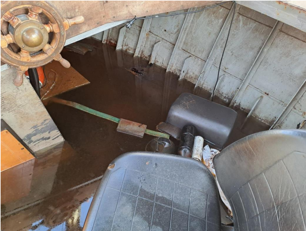
Kuva 11. Hinaajan ohjaushytti