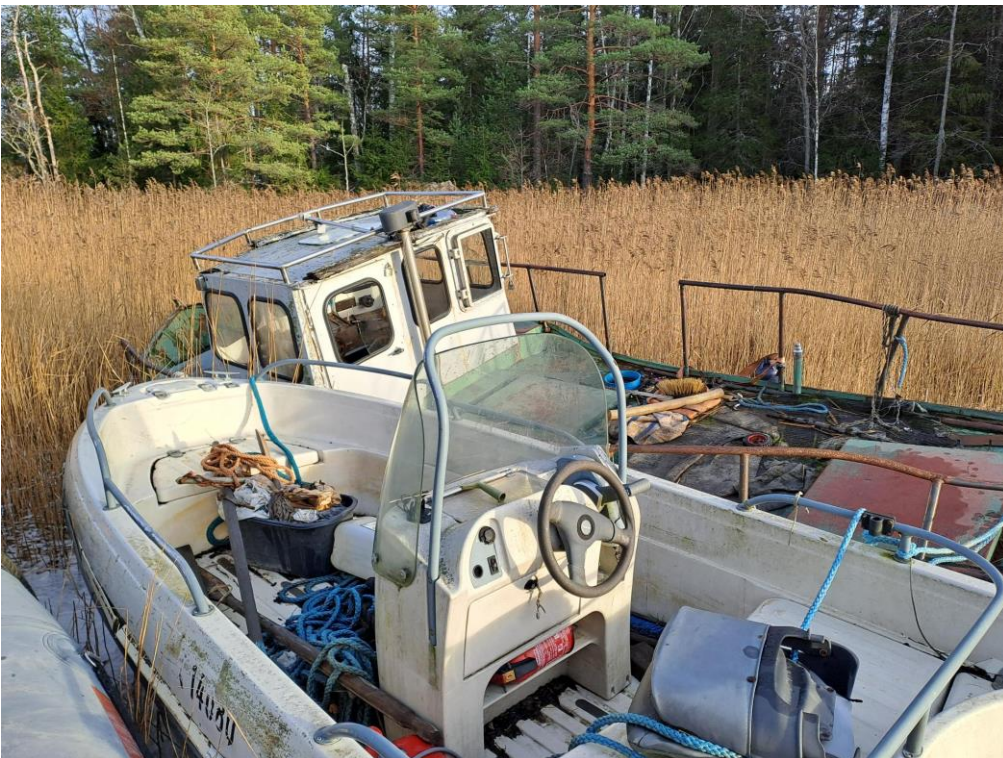
Kuva 16. Molemmat veneet