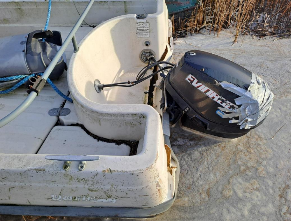
Kuva 1. Moottorivene