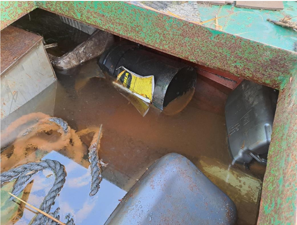
Kuva 3. Hinaajan ruuma