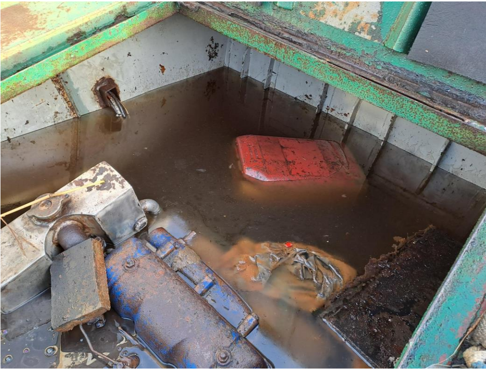
Kuva 5. Hinaajan moottoritila