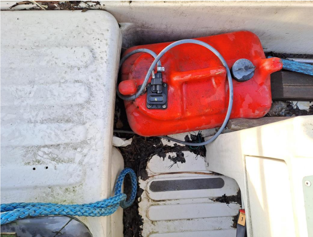
Kuva 15. Moottorivene