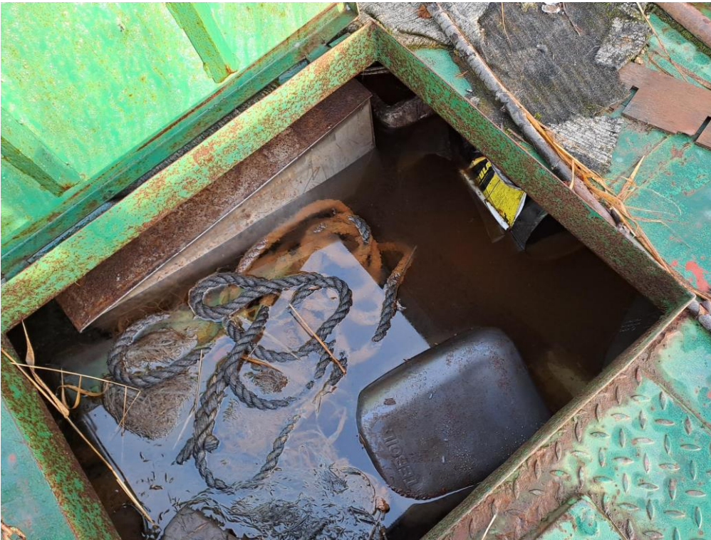
Kuva 2. Hinaajan ruuma