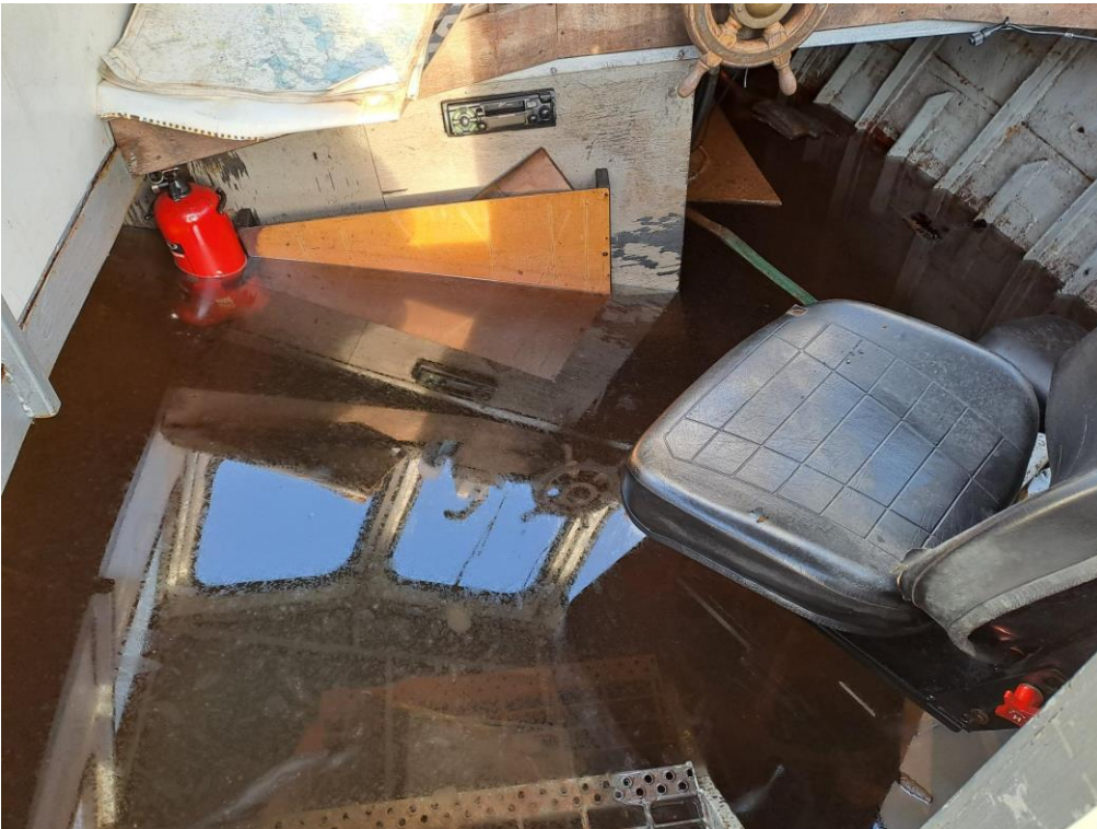
Kuva 8. Hinaajan ohjaushytti