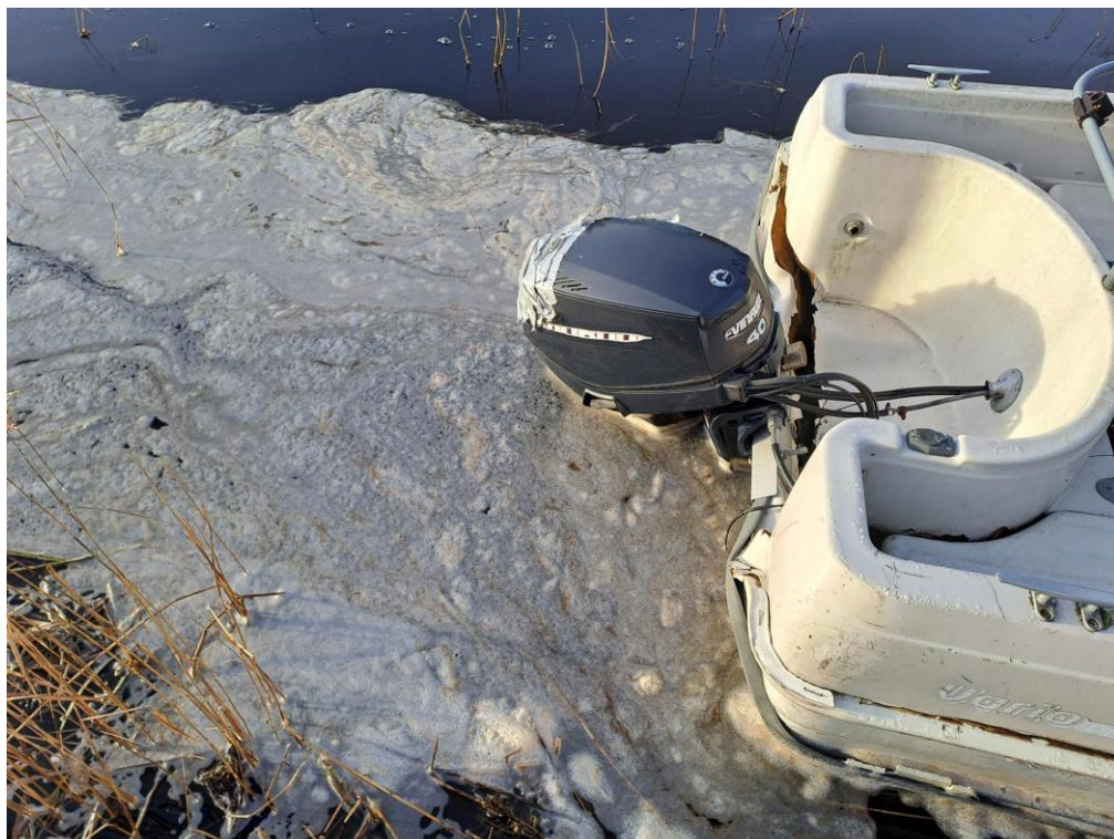
Kuva 14. Moottorivene