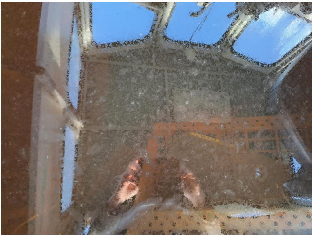
Kuva 10. Hinaajan ohjaushytti