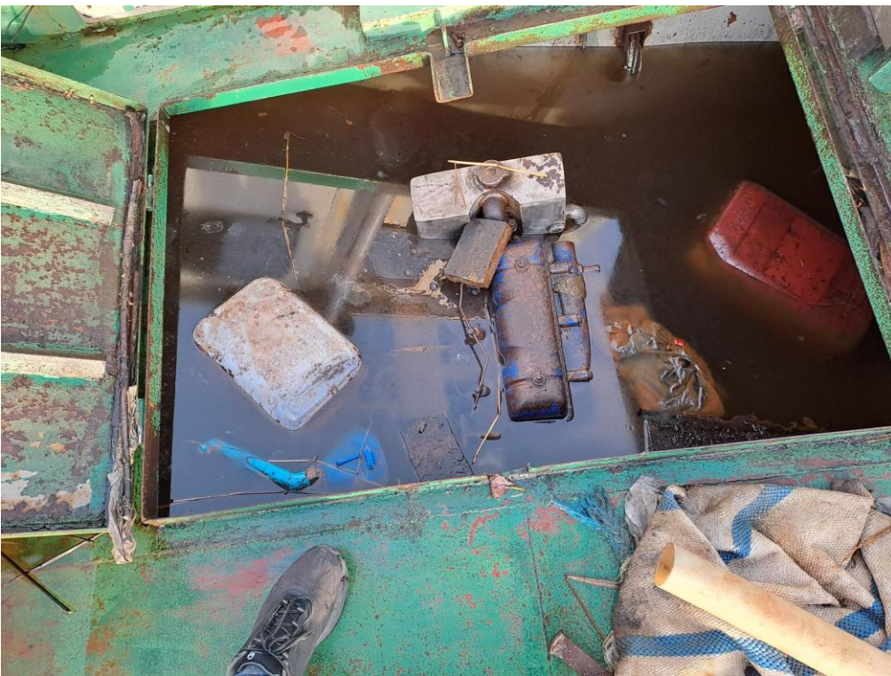
Kuva 4. Hinaajan moottoritila