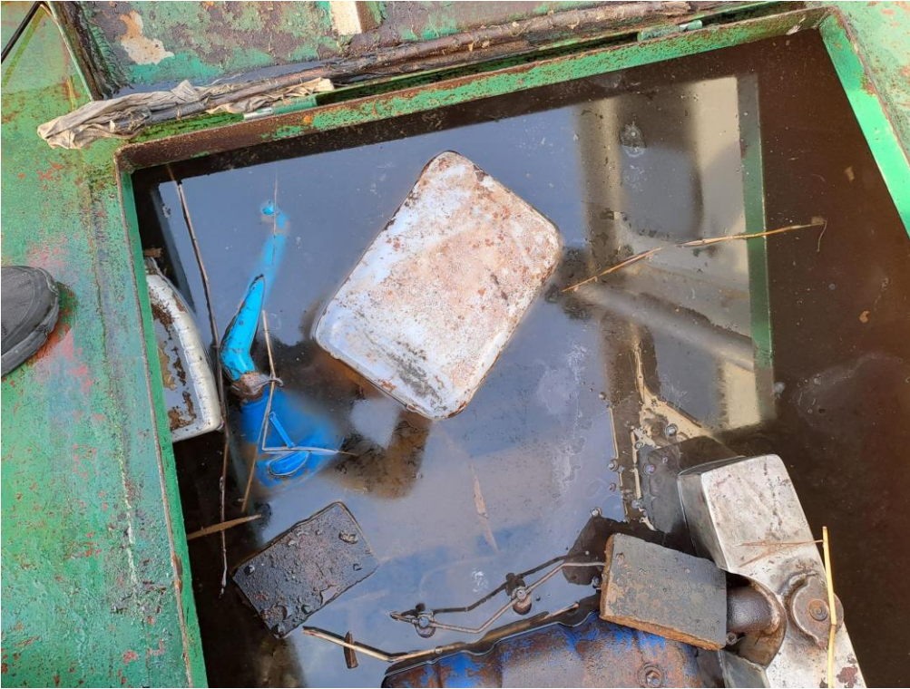
Kuva 7. Hinaajan moottoritila