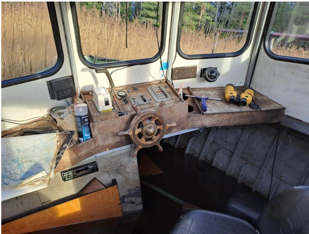
Kuva 9. Hinaajan ohjaushytti