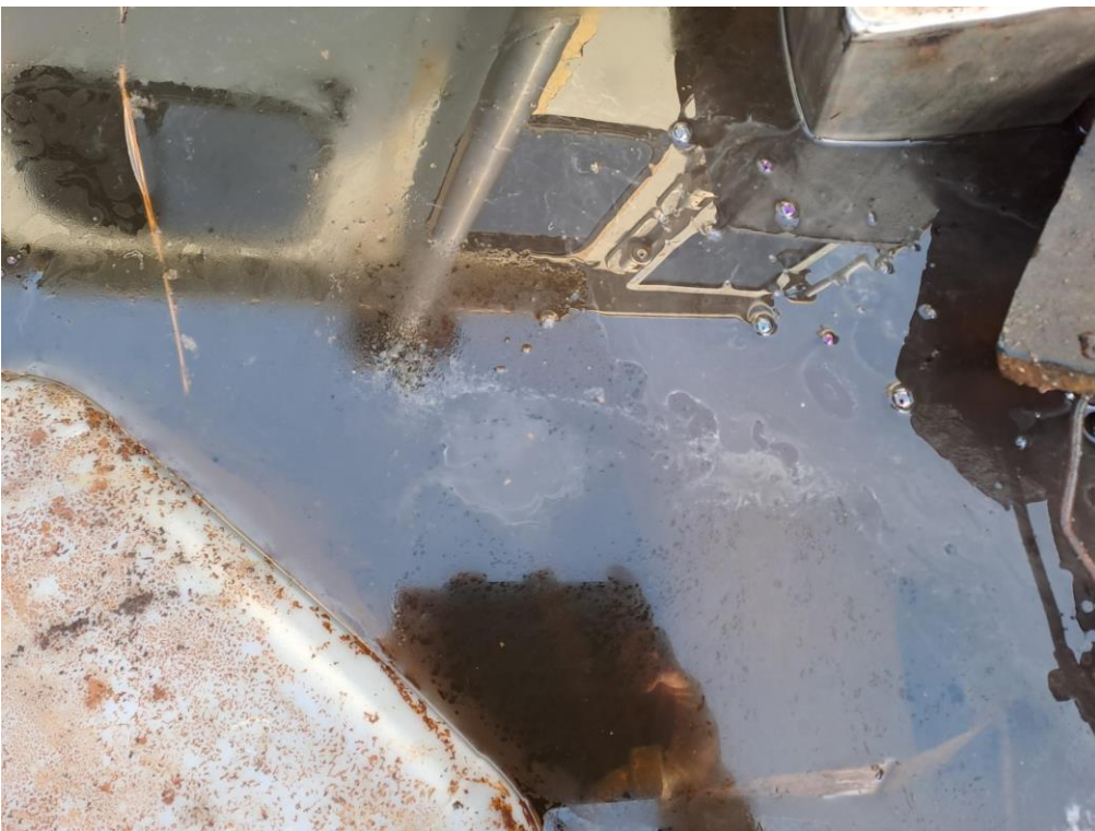
Kuva 6. Hinaajan moottoritila